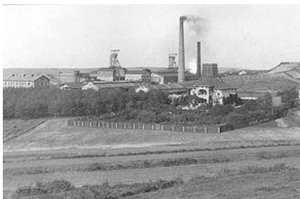
Zabytkowe zdjęcie kopalni „Janina”