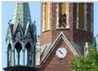
Kościół „Przemienienia Pańskiego”