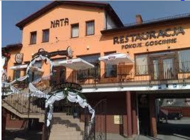
Hotel i restauracja „Nata”