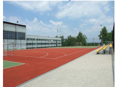
OBIEKTY SPORTOWE TURNIEJU LIBIĄŻ CUP